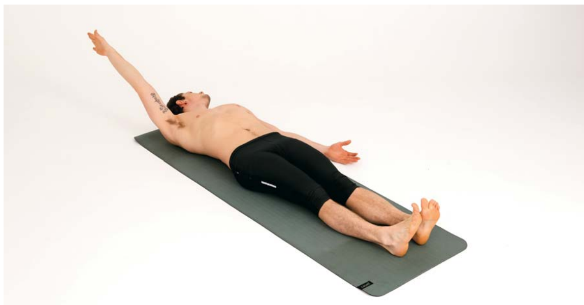
Strekkøvelser som løsner på spenningskjeder for å aktivere svake muskler og bevegelser andre steder i kroppen

Nå vil jeg slå i hjel en gammel myte om pust. Vi puster ikke med magen, vi puster med lun-