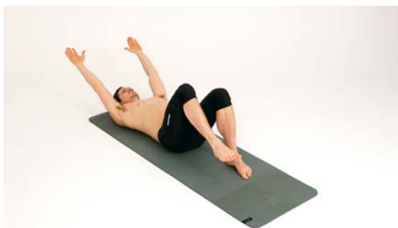
Holdningsøvelse innen kinestesi

Ved behandling av kraftig hodepine, får pasien-ten behandling på kjeven, bekken og føtter. Kinestesibehandling behandler kroniske muskel og skjelettplager, smerter og plager i muskler og ledd i: føtter, ankler, knær, ben, bekken, rygg, bryst skuldre, armer, albuer, hender, nakke og hals.