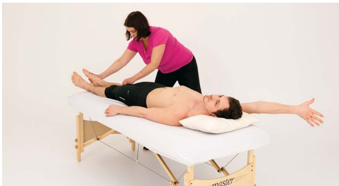
Pasient som får behandling med kinestesi

Behandlingen gikk ut på at pasienten lå på ryggen i en sjøstjerne på behandlingsbenken, med hodet bakover, samtidig som jeg forsiktig strakk ut de korte, overspente musklene og spenningskjeden som disse musklene var en del av. I tillegg fikk mannen et hjemmeprogram med strekkøvelser, hvor han blant annet skulle ligge i en sjøstjerne hver dag i to minutter i fire uker. Han fikk også øvelser som skulle aktivere tyngde og balansepunktet tilbake til der det skulle være. Etter fire uker med